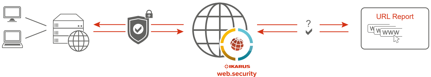
Abb. 1 - Zentraler Security-Proxy mit verlässlicher Malware-Erkennung, flexiblen Filter-Möglichkeiten und globaler URL-Kategorieliste.

Dank Multimandantenfähigkeit und übersichtlicher Benutzerverwaltung ist IKARUS web.security nicht nur für den klassischen Einsatz in Unternehmen perfekt geeignet. Großkonzerne und auch Internet Service Provider profitieren von der Möglichkeit, den Service unter Ihrer eigenen Marke und im eigenen Design anbieten zu können. Setzen Sie Landing- und Block-Response Pages für Ihre Botschaften und Zwecke ein – beispielsweise zur Registrierung in Ihrem Netzwerk, um Nutzungsbedingungen zu kommunizieren oder für gezielte Werbebotschaften. Auch alle weiteren Instanzen können unabhängig gestaltet werden und bieten Ihren Kunden ebenso viel Gestaltungsspielraum.