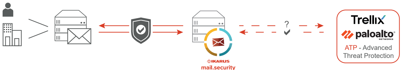
Abb. 1 - IKARUS mail.security scannt alle eingehenden E-Mails, bevor Sie an Ihr Netzwerk übergeben werden. Die Sandboxes von Trellix und PaloAlto zur Advanced Threat Protection können optional zugeschaltet werden.

Ihr zusätzliches Plus an Datensicherheit: Die Software-Entwicklung, Datenverarbeitung, Analyse und Support für IKARUS mail.security erfolgen in Österreich unter penibler Einhaltung der europäischen Datenschutzgrundverordnung. Es werden keine Daten an Dritte weitergegeben, alle Analysen – inklusive Sandbox-Analysen durch Partner-Unternehmen finden ausnahmslos im Rechenzentrum in Wien statt.