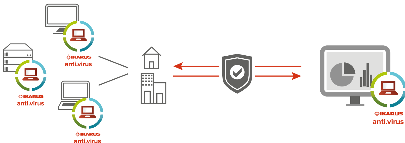
Abb. 1 - IKARUS anti.virus in the cloud schützt Laptops, Desktops und Server vor gefährlichen Programmen und unerwünschten Eindringlingen. Die Software kann direkt am Endgerät oder über ein Web-Interface gesteuert werden.

Die Kommunikation läuft abgesichert über das Internet und damit unabhängig von den Standorten der verwalteten Geräte. IKARUS anti.virus in the cloud ist multimandantenfähig und beliebig skalierbar. Der Vorteil der übersichtlichen Administration aller verwalteten Lizenzen und Geräte mit einem einzigen Login bleibt bei jeder Größenordnung bestehen. Für das Management fallen weder zusätzlichen Lizenzkosten noch Aufwände für Installation, Update oder Wartung an.