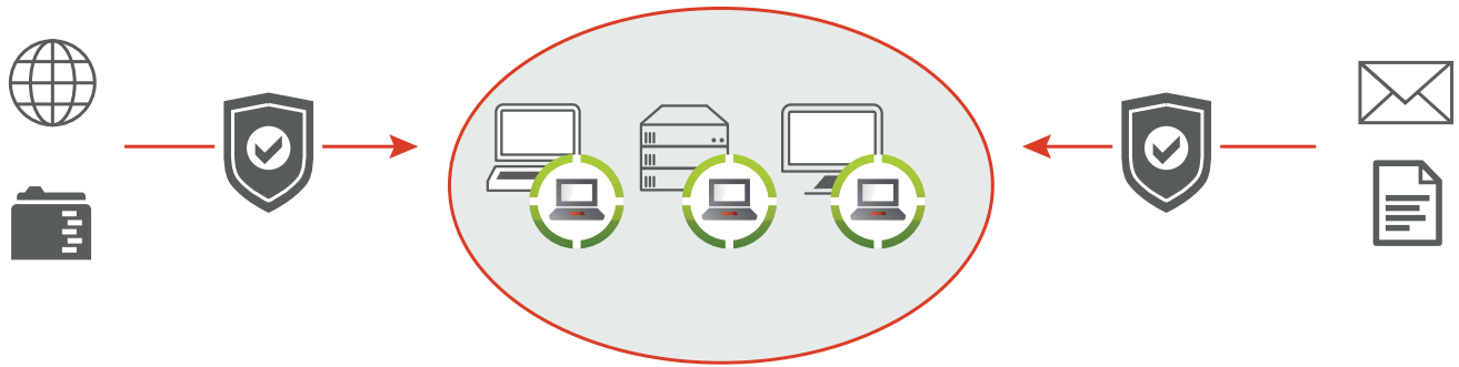
Abb. 1 - IKARUS anti.virus Home schützt Windows PCs, Notebooks und Laptops vor gefährlichen Programmen oder unerwünschten Eindringlingen.